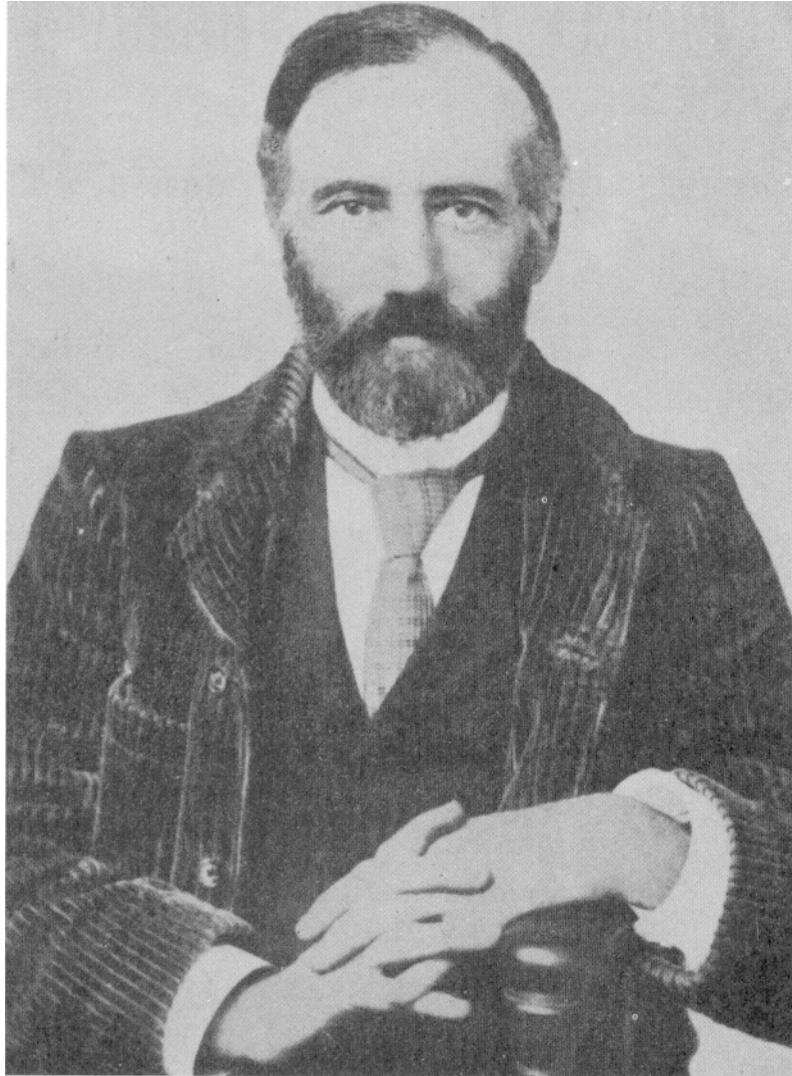
WILLIAM Q. JUDGE 1851•1896

IN COPERTINA: È raffigurato il simbolo della DEA EGIZIA MUT in forma di avvoltoio; l'originale è a Tebe in un affresco della regina Hachepsut (1511-1480 a.C.). MUT è la DEA MADRE; la Divinità Primordiale “da cui tutti gli Dei sono nati”. Simboleggia anche la Sapienza nel suo aspetto dinamico e creativo.